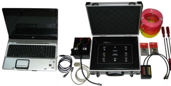
Gambar 1. Alat resistivitas S-Field 16 elektroda otomatis multichannel

S-Field adalah alat ukur resistivity dengan sentuhan teknologi terdepan. Instrumen didesain dengan sistem pengukuran elektroda banyak channel (multichannel), full otomatis dengan sampling arus injeksi dilakukan setiap 2-5 detik. Alat ini memberikan hasil dengan tingkat akurasi tinggi dan bising yang rendah. Dengan hadirnya alat ini pengukuran resistivitas bisa dilakukan secara simultan sampai 16 elektroda, dan dapat pula di-upgrade menjadi 32, 64, 128 elektroda atau lebih (max 1000 channel). Dengan demikian akan menghemat waktu dan tenaga dalam pengukuran resistivitas bawah permukaan. Melalui instrumen resistivity multichannel pengukuran data resistivitas 2D dan 3D menjadi lebih efisien. Teknologi Current Source (pembangkit arus) yang terdapat pada S-Field menjadikannya handal, berpengaman sistem anti short circuit , sehingga aman digunakan pada saat jarak elektroda arus terlalu rapat atau impedansi sangat rendah. Output format file hasil pengukuran 2D sesuai (compatible) dengan format software Res2Dinv.